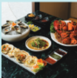
Jumbo Lobster Riverside Bangkok