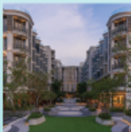
Salil Journey Riverside